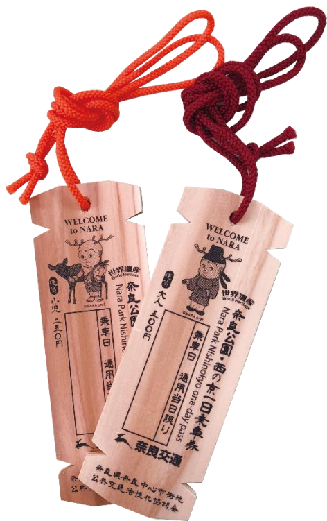
図. 木簡型一日乗車券